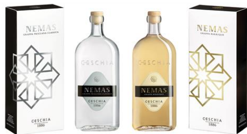
NEMAS CLASSICA - NEMAS BARRIQUE | 70CL - 6 BOTT. CLASSICA - GCNF070 CLASSICA ASTUCCIO - GCNFC070A BARRIQUE - GCNBA0700 BARRIQUE ASTUCCIO - GCNBA0700A