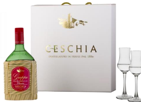
GRAPPA CESCHIA CLASSICA + 2 BICCHIERI FORMATO 70CL - BOXCLASSICA70 COLLO DA 3 CONFEZIONI