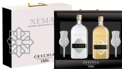
NEMAS CLASSICA + NEMAS BARRIQUE + CALICI FORMATO 70CL - BOXNEMAS702 - 3 CONFEZIONI