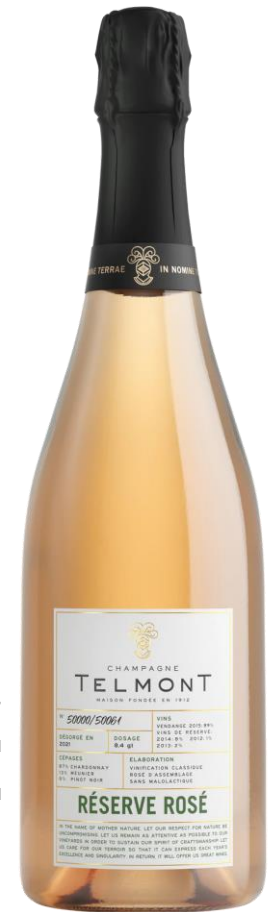
ART. TC01 | FORMATO 75 CL - 6 BOTT.

Un'espressione genuina del terroir d'origine e un tributo all'eccellenza di ogni singola annata.