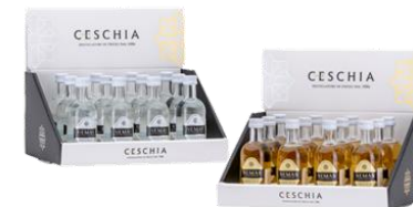
NEMAS MIGNON CLASSICA/BARRIQUE CLASSICA - GCN00540IT001 BARRIQUE - GCN00540IT001 FORMATO 5CL IN ESPOSITORI DA 12 BOTT.