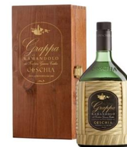
GRAPPA GIACOMO CESCHIA FORMATO 70CL - GCNERA0700 - 1 PEZZO.