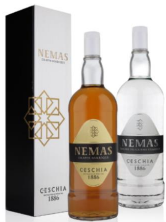
NEMAS MAXI FORMATO 3 LT - 1PZ CLASSICA - GCNF3000 BARRIQUE - GCNBA3000